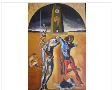
Gli atleti cosmici - omaggio a Dalì - olio su tela - 1998