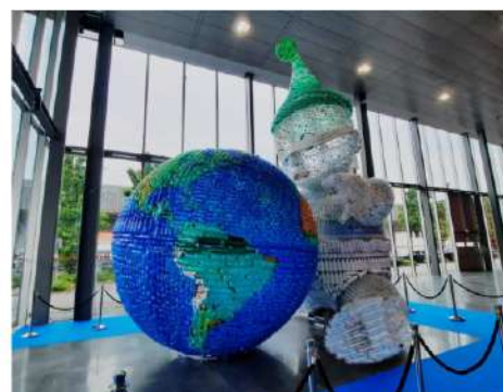
Eppure il sole splende ancora - 14.600 bottiglie di plastica - 570x480x679cm - 2023