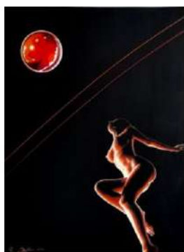
The black rainbow - olio su tavola - 2024

Di seguito alcuni riferimenti fotografici significativi delle sue opere: